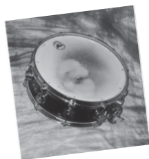
1 Kessel 2 Schlagfell 4 Spannreifen

Der Snaredrum-Kessel kann aus Holz oder Metall gefertigt sein. Die Snaredrum besitzt ein Schlag- und ein Resonanzfell, am Resonanzfell liegt der Snare-Teppich an. Die Felle werden mittels Spannreifen am Kessel gehalten und gestimmt. Die Snaredrum ist die wichtigste Trommel im Drumset - sie ist das Zentrum des Drumsets.