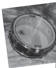
3 Resonanzfell 5 Snare-Teppich