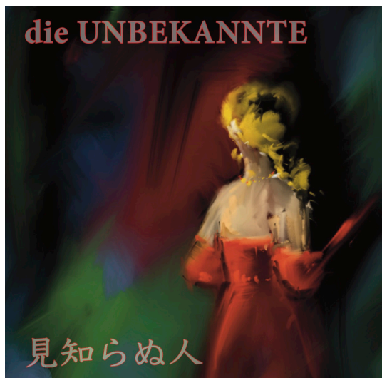
CD: Die Unbekannte (2018)

57 Jahre später ist nun wieder eine Musicalette entstanden. In der bewussten konstruktiven Auseinandersetzung zweier Generationen (Vater/Sohn) soll nun eine Mischung der Genres Wiener Operette und Musical – unter Berücksichtigung von Elementen der heutigen Trendmusik – zu einem neuen Genre, der Musicalette 2021 verschmelzen. Der Handlung bzw. dem Konzept angepasst, bietet die Musik daher eine breite Palette an Musikstilen von der klassischen Ballade, über „Schlager-“ und Trendmusik (u.a. Elektroswing). Klänge, angelehnt an die Operette sind ebenso zu hören und werden vor allem dann sehr bewusst als Stilmittel eingesetzt, wenn Alfons in die „virtuelle Welt“ der Internet-Partnervermittlungsplattform eintaucht und dort – auch das Frauenbild betreffend – als 75-jähriger Leopold sein operettenhaftes Unwesen treibt. Die Musik soll punktuell sehr bewusst einen Gegenpol zum Text/Handlung bilden (Parodie).